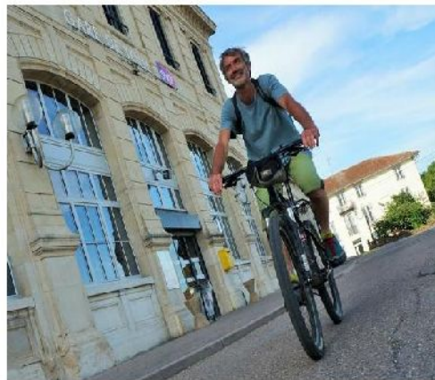
En 39 ans, il a économisé l'équivalent du prix de deux voitures neuves, sans compter des milliers de litres de carburant.